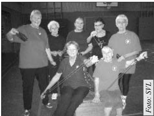
Der SV Lindenberg hat Angebote für alle Altersgruppen, hier die Damengymnastik.

Es ist nahezu unmöglich, alle Aktivitäten und Highlights des SV Lindenberg in wenigen Zeilen