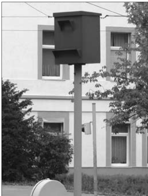
Blitzgeräte wie dieses am Radeklint wird es in unserem Stadtbezirk vorerst nicht geben.